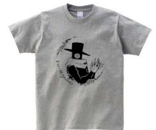
【オリジナルTシャツイメージ】