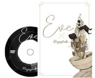
【オリジナルDVDイメージ】

[A賞] 1名様：オリジナル夢うた 夢に向かって頑張るひとのためにEveが作詞作曲したオリジナル応援ソングをEveの世界観溢れるオリジナルミュージックビデオにして、直筆サインを入れた世界でたった一枚のDVDです。