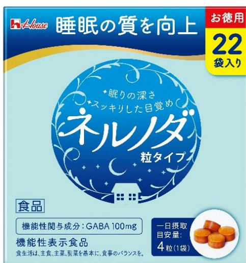
「ネルノダ粒タイプ」<22 袋>

ハウスウェルネスフーズは、睡眠の質の向上に役立つ機能があることが報告されているGABAを配合した機能性表示食品「ネルノダ」シリーズより、 「ネルノダ粒タイプ」<22袋> を2月17日より全国で発売いたします。