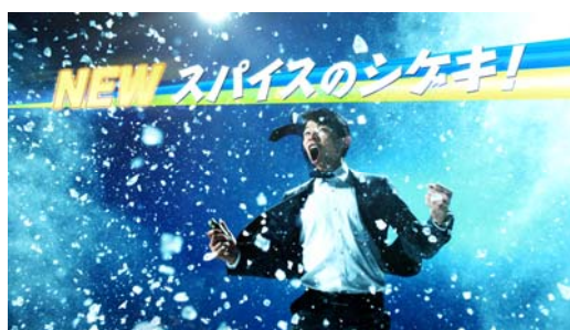
新TV-CM「鈴木亮平登場」篇より

新TVCMは4/1(水)17:00よりブランドサイトにてご確認頂けます。 http://megashaki.house-wf.co.jp/