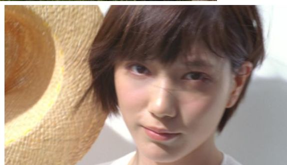
新TV-CM「夏、C1000ビューティー！」篇より

CM動画は5/6(水)よりブランドサイト内でご確認いただけます。C1000公式ブランドサイト http://www.c1000.jp/